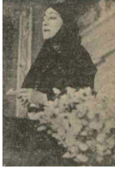
Hüda Şaravi Kürsüde Konuşmasını Yaparken 18

Hüda Şaravi, kongrenin ikinci günü kürsüde konuşmasını yaparken İstanbul'un doğu ve batı arasında köprü görevi gördüğünü belirttikten sonra yine Atatürk'e ve onun sözlerine de konuşmasında yer vermiştir: