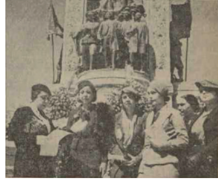
Mısır Murahhasları Taksim Cumhuriyet Anıtı Önünde 15

Kongreden önce Mısır ve Yugoslav delegeleri birlikte Taksim Cumhuriyet Anıtı’na çelenk bırakmaya gitmişlerdir. Bu esnada Mısır heyeti başkanı Şaravi, tekrar Atatürk’e verdiği değeri tasdikler nitelikte şu sözleri söylemiş ve kendisine iyi dileklerini iletmiştir: